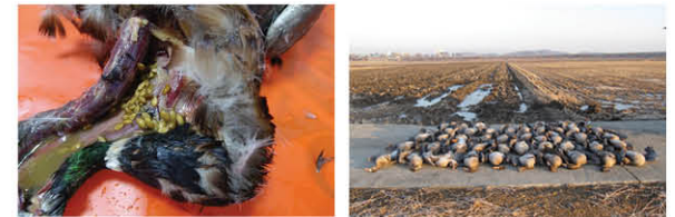
(폐사체 부검 시 식도에서 검출된 벌씨) (기러기 및 오리류(청둥오리) 집단폐사)