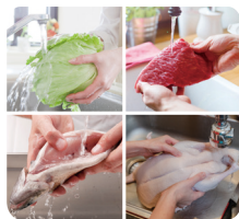
채소류 → 육류 → 어패류 → 가금류 순으로 세척