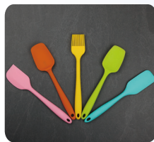
용도별 조리도구 구분 사용