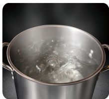
조리도구 열탕소독 또는 염소소독 실시