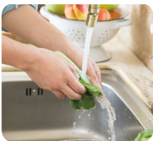
흐르는 물에 3회 이상 세척