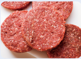
쇠고기(특히 간 쇠고기, 햄버거) 및 쇠고기 육제품(햄, 소시지)