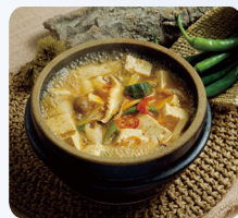
무더운 여름에는 가열(75°C 이상)식품 위주로 섭취

*최근 5년간('20~'24년) 6월에 발생한 식중독 현황을 분석한 자료입니다.