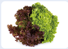
시금치, 상추 등 생채소, 새싹채소 및 샐러드, 과일