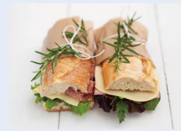
보균자에 의해 조리된 식품 (도시락, 샌드위치)