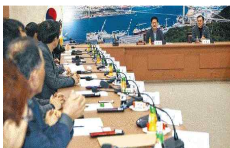
지역사회보장계획의시행결과 심의회개최(2.28) - 동구지역사회보장대표협의체