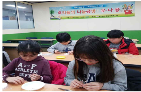
한화케미칼 사회공헌 지원사업(3.8~22) - 동구종합사회복지관