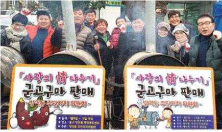
사랑의情나누기 군고구마판매 (1.9~15) - 방어동주민자치위원회