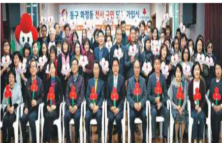
천사구민단체 가입식(3.26) - 화정동지역사회보장협의체