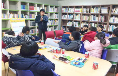
지역활동주민모임『우리마을알기』(1.29) - 동구종합사회복지관