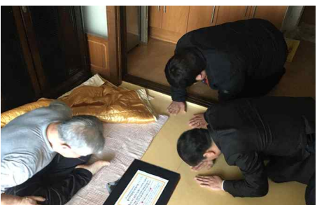
설명질나눔행사 『행복하게, 나눔하기』(2.13) - 화정종합사회복지관