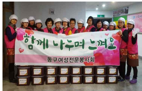
저소득 부자가정지원 밑반찬 만들기 (3.20) - 동구여성전문봉사회