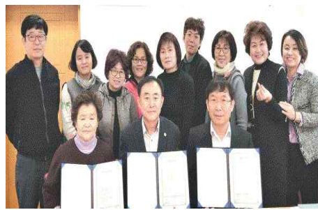
복지사각지대 발굴 업무협약(3.22) - 동구종합사회복지관·대송동지역사회보장협의체