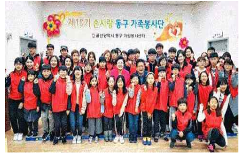
제10기 가족봉사단 발대식 (3.10) - 동구자원봉사센터