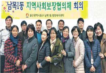
특화사업 추진실적보고 및 2018년계획 논의 (3.7) - 남목1동지역사회보장협의체