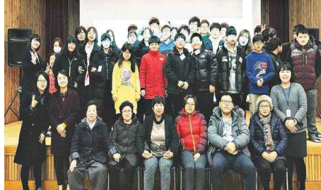
누리봄청소년방과후 아카데미진행 (1.13) - 동구청소년문화의집