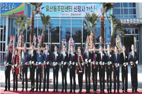
신청사 개소식 (3.14) - 일산동주민센터