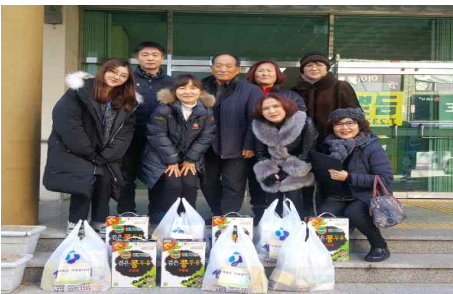
홈노인가구 손편지및선물 전달(1.29) - 전하2동 지역사회보장협의체