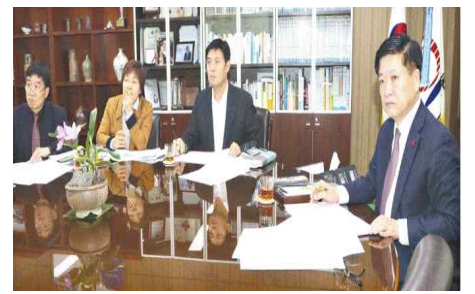
동구치매안심센터 건립 용역보고회(1.31) - 울산동구보건소