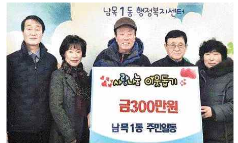
온누리 상품권 300만원 전달 (2.13) - 남목1동 지역사회보장협의체