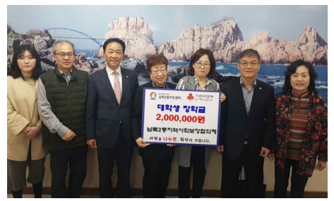
희망나눔 대학생 장학금전달 (3.29) - 남목2동지역사회보장협의체