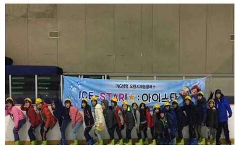
ING생명 오렌지 재능클래스 사업(3.6~27) - 동구종합사회복지관