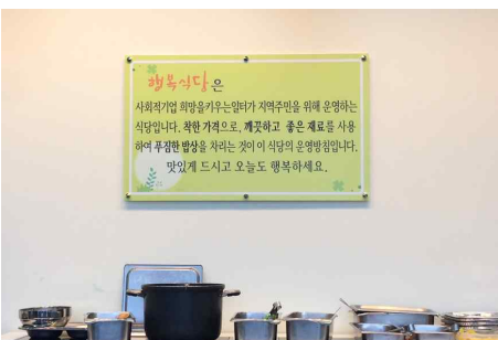
사회적기업 행복식당 개소 (3. 20) - 희망을 키우는 일터