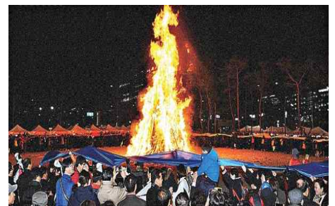
정월대보름 달맞이행사 (3.2) - 동구일산해수욕장·주전شط터공원