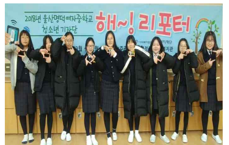
명덕여중과 함께하는 기자단 『해~리포터』 발대식(3.20) - 화정종합사회복지관