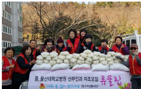
재가노인 설날 떡국배달 (2.9) - 동구여성봉사단