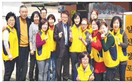
어르신 식사대접 (3.26.) - 일산동 아동여성지킴이단