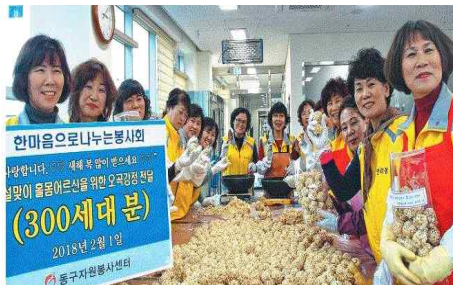
설맞이 옹곡강정300세대 나눔 (2.1) - 한마음으로 나누는 봉사회