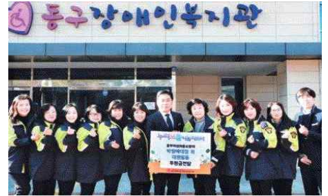
동구장애인 복지관 선금전달(1.15) - 동부여성의용소방대